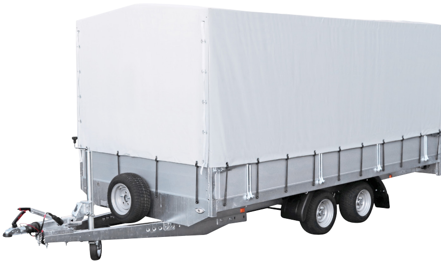
Optie: kader met zeil