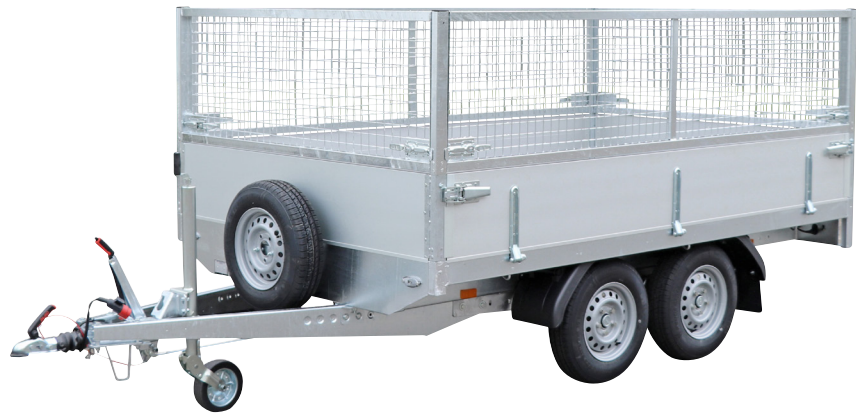
Optie: opbouw draadnet